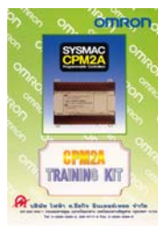
คู่มือฝึกอบรม CPM2A